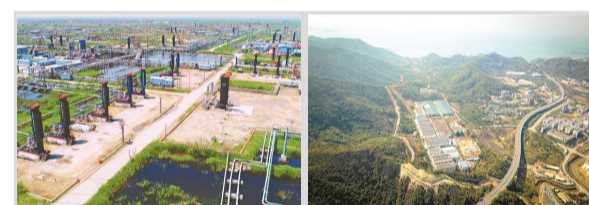
辽河油田特油公司筑牢绿色发展根基