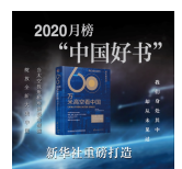
60万米高空看中国 十四