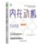
内在动机 自主掌控人 生的力量