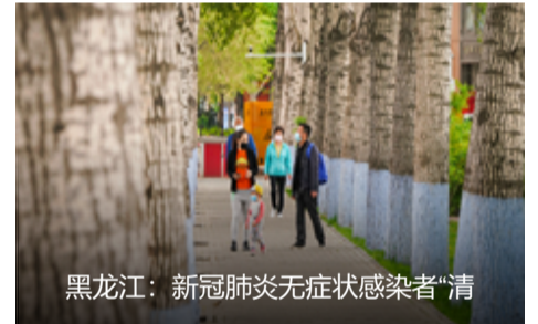
黑龙江：新冠肺炎无症状感染者“清