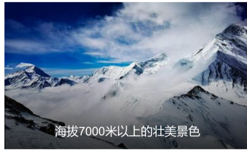
海拔7000米以上的壮美景色