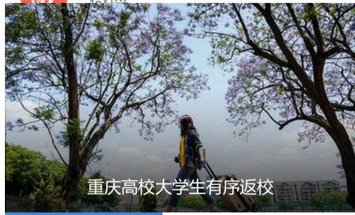
重庆高校大学生有序返校