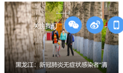
黑龙江: 新冠肺炎无症状感染者“清