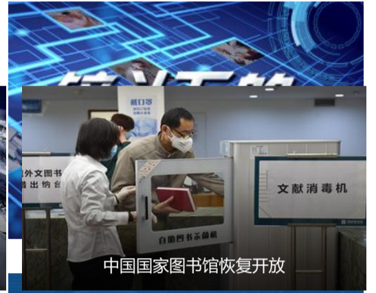
中国国家图书馆恢复开放