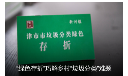
“绿色存折”巧解乡村“垃圾分类”难题