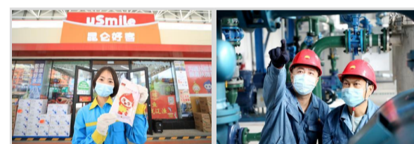
图片新闻 提质增效勇担当