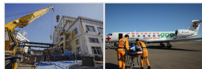
短停检修 优化流程 中俄联手 应急演练