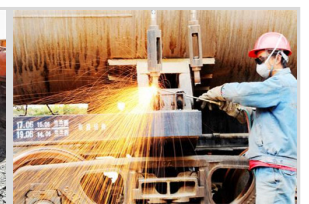
拆除报废设备 建设美丽工厂