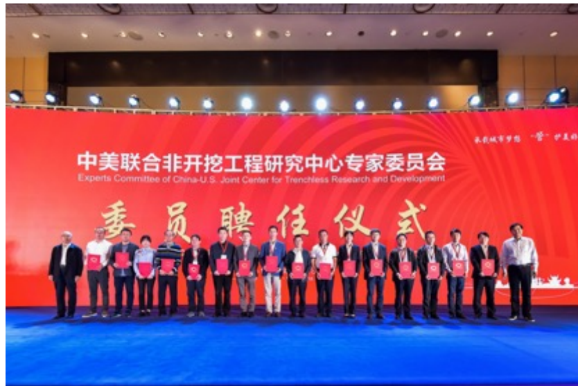
工程中心专家委员聘任仪式