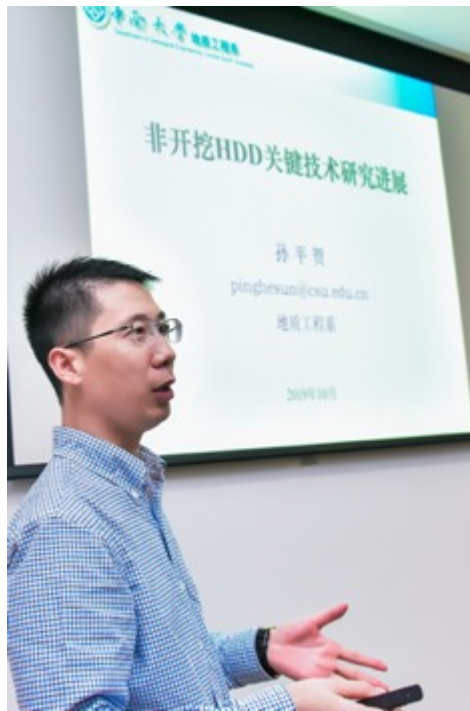
我校非开挖HDD发展现状介绍