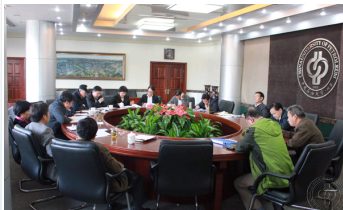
【群众路线教育实践活动】中国石油大学党委中心组召开专题理论学习会