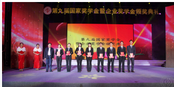
中国石油大学举行第九届国家奖学金暨企业奖学金颁奖典礼