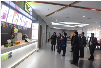
北京市党建先进校评选考察组在石大实地考察走访