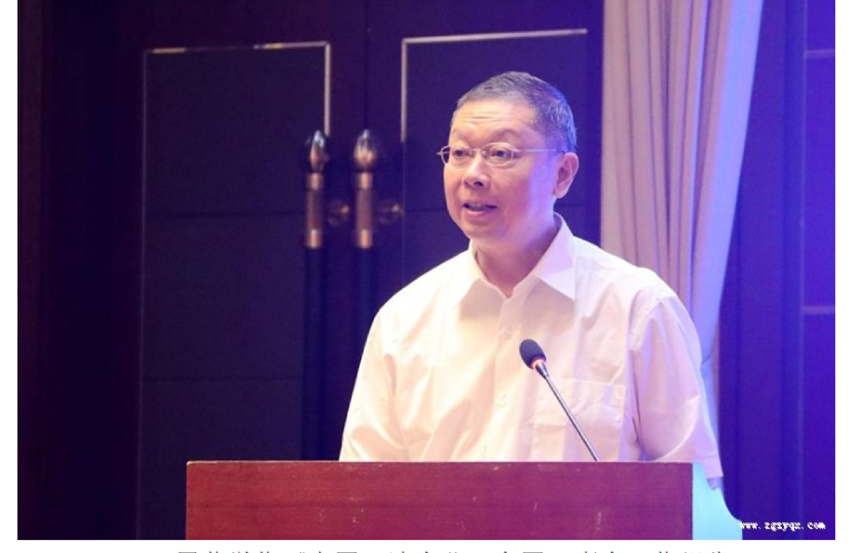
周荣学作《中国石油企业》全国理事会工作报告