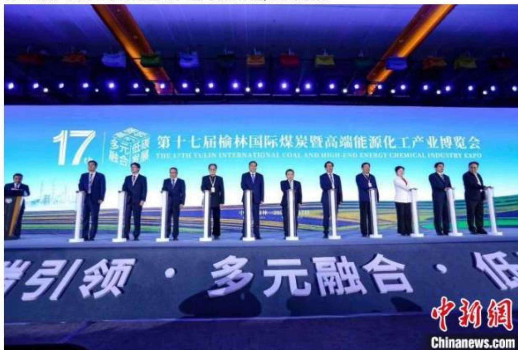
第十七届榆林国际煤博会开幕。

本届煤博会展览展示规模大,设立了智能制造、高端装备、低碳发展等6个展区,参展企业达到756家,展示面积突破6万平方米。专项活动有特色,围绕能源化工、聚焦转型发展,突出高端化、装备制造、金属镁、氢能、羊毛绒等重点产业,通过院士论坛、产业推介、经贸洽谈、集中签约、时装展示等多种形式,专家学者与中外企业齐聚一堂,共话新机遇、共谋新发展。