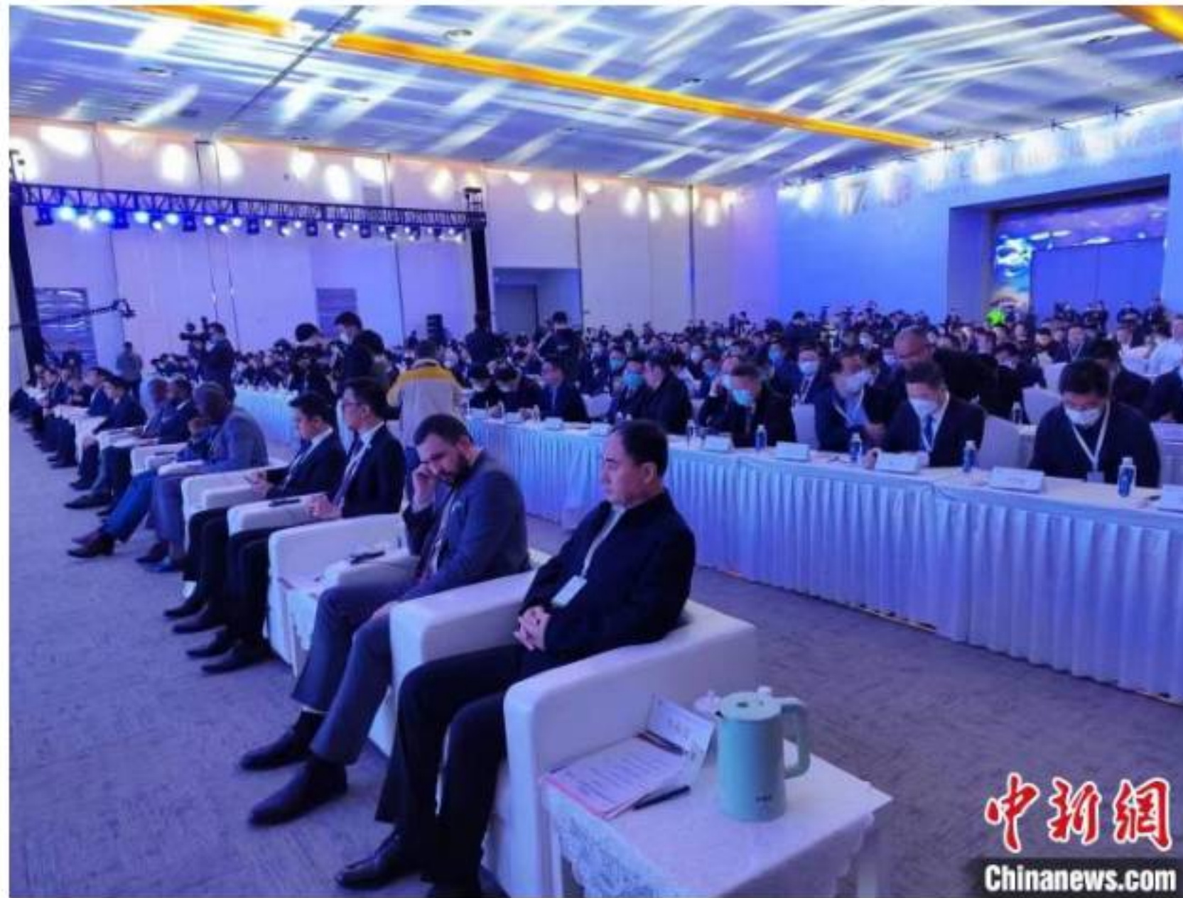
第十七届榆林国际煤博会开幕。

中新网陕西榆林4月7日电(记者阿琳琳)4月7日,以“高端引领、多元融合、低碳发展”为主题的第十七届榆林国际煤炭暨高端能源化工产业博览会在榆林会展中心开幕。