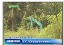
海南打响闲置土地专项清理硬仗