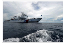
“海巡21”船西沙海域巡航执法