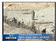
新疆:国家特大型地灾防治工程月底投用