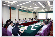
中比例尺区域地质调查成果对社会公开服务