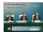
韩正出席中国环境与发 展国际合作委员会2018年年 会开幕式并讲话