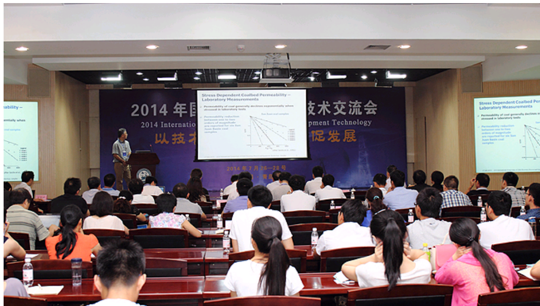
国际煤层气开采工艺技术交流会场

作者: 科技处: 谭树成 机电工程学院: 刘延鑫 来源: 本站 发布时间: 2014年07月30日 点击数: