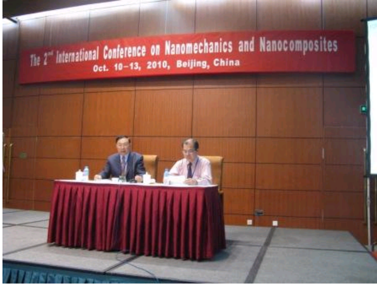
杜善义院士和米耀荣院士主持会议