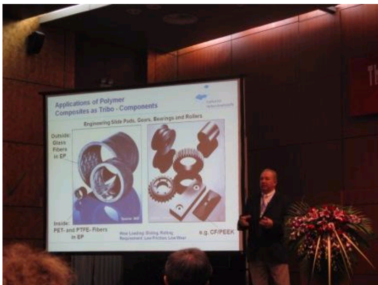
Klaus Friedrich教授作大会特邀报告