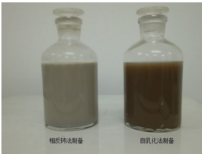
图2 石墨烯改性上浆剂