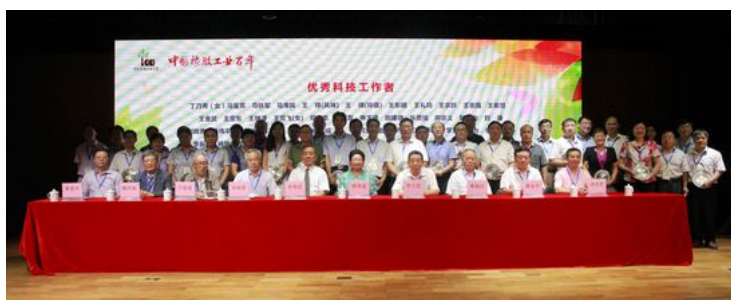
优秀科技工作者与领导合影