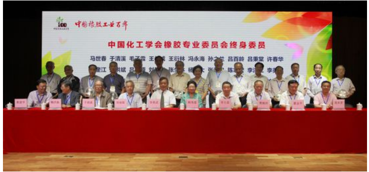
中国化工学会橡胶专业委员会终身委员与领导合影

纪念活动结束后，同时举行了“第11届中国橡胶基础研究研讨会”和“中国橡胶百年——广州论坛”。