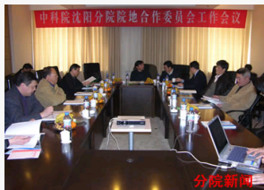
沈阳分院召开2008年院地合作委员会工作会议