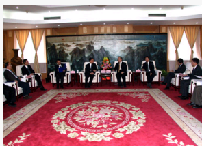
路甬祥会见辽宁省委书记张文岳