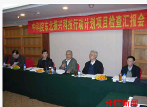
中科院东北振兴科技行动计划项目顺利通过阶段检查