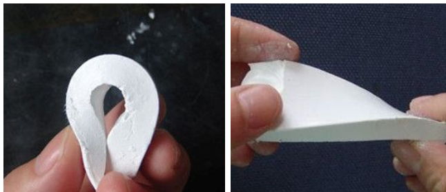
由PIBM体系制备的 Al_2O_3 陶瓷湿坯

PIBM自发凝固成型技术应用于大尺寸先进陶瓷材料的制备, 具有显著的原创新性和先进性, 将为我国半导体制造装备国产化所需的大尺寸陶瓷部件提供一条新的低成本制造方法。该研究获得中科院平湖新材料中心项目、上海市优秀技术带头人项目、国家自然科学基金面上项目和科技部重点研发计划支持。