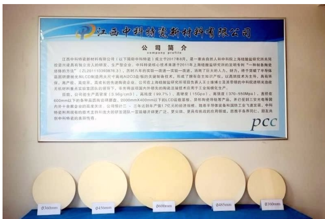
直径360mm - 600 mm多种规格高纯氧化铝陶瓷研磨盘