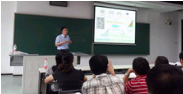
我中心老师参加中国化学会第29届学术年会