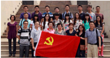
先进弹性体材料研究中心纵向党支部赴西柏坡学习实践