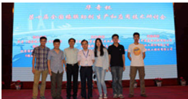
我中心师生参加第十届全国橡胶助剂会议