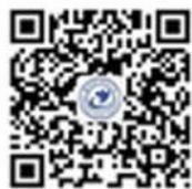
杭州电子科技大学官 方微信