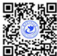
杭州电子科技大学官 方微博