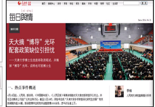
人民网每日舆情:天大...