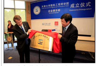
天津大学成立国际工程...