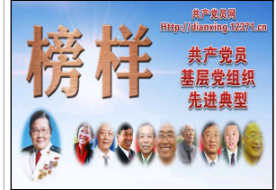
中央组织部推出“榜样...”