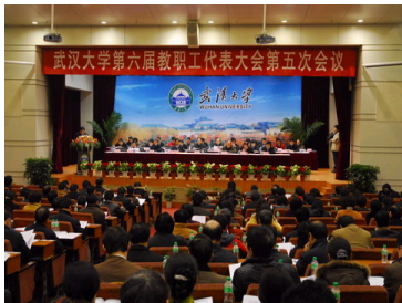
学校六届教代会五次会...