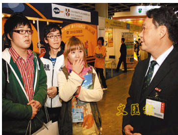
武大组团参加香港教育...