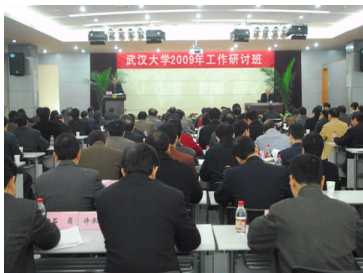
学校举办研讨班研究部...