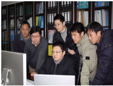
测得更快 绘得更好...

据了解，地球空间信息在全球范围的年产值已达500亿美元，并以每年20%的速度增长，中国目前正处于大规模产业化的前期。湖北省和武汉市有关方面将于近期出台产业规划和配套扶持政策，引导相关企业聚集光谷。