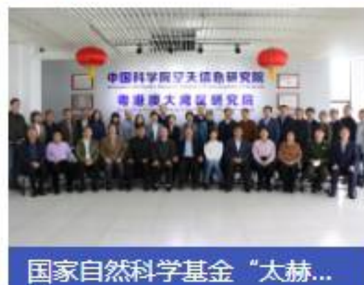
国家自然科学基金“太赫...