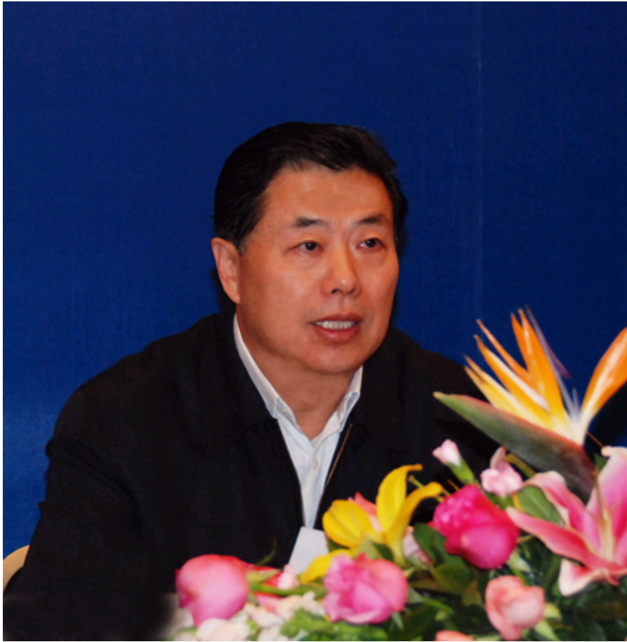
中国水土保持学会理事长、水利部副部长鄂竟平出席会议并讲话