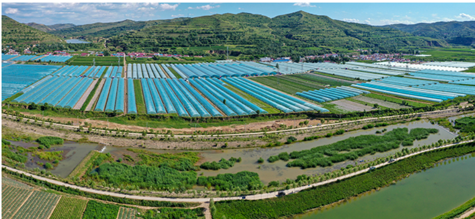
宁夏隆德县渝河流域沙塘镇特色产业园区