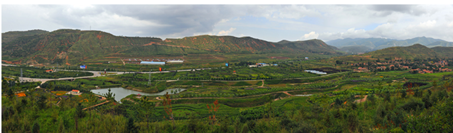
宁夏隆德县清流水利风景区