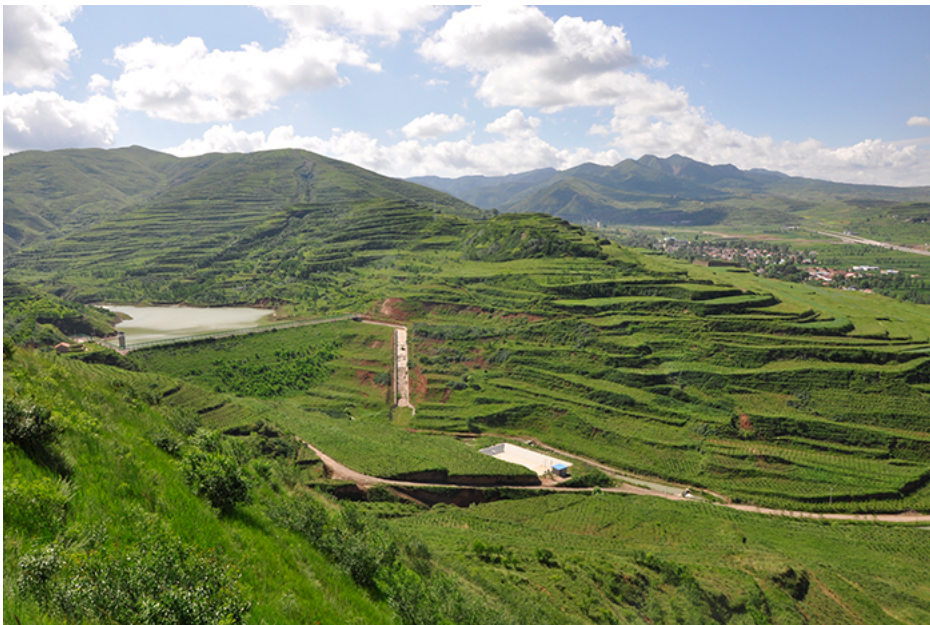
宁夏隆德县城南生态清洁型小流域综合治理工程