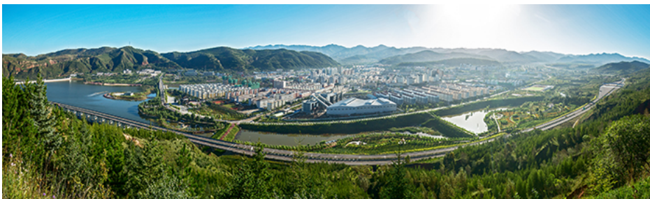
宁夏隆德县南河生态清洁型小流域