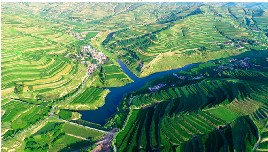
宁夏隆德县神林乡阴洼小流域