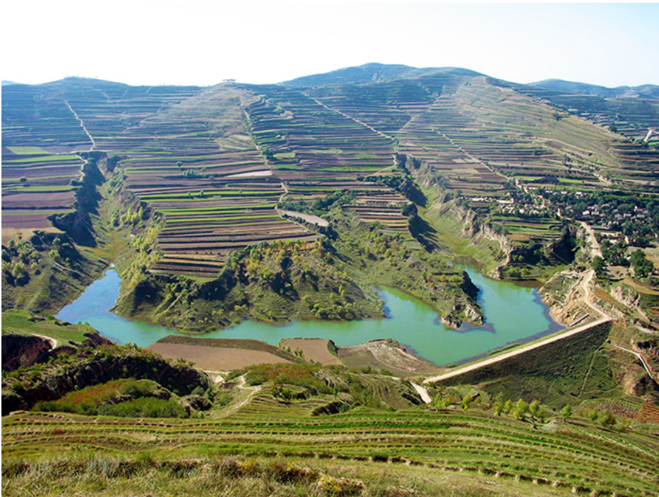
宁夏隆德县张程乡五龙流域桃园骨干坝