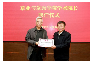
南志标院士受聘草业与草原学院学...