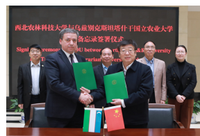
吴普特会见乌兹别克斯坦塔什干国...