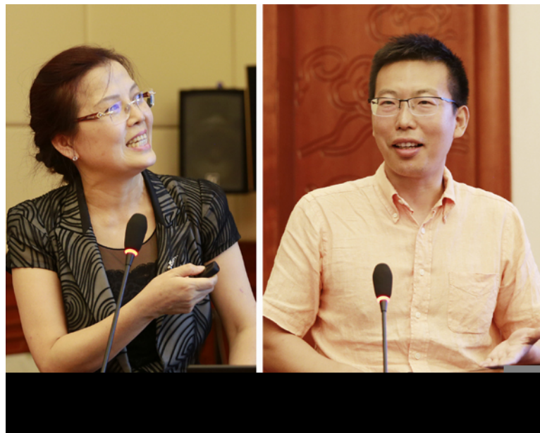
国家基金委刘羽处长和中国科学院前沿科学与教育局段晓男处长在研讨会上作专题报告

国家基金委地球科学部三处处长刘羽和中国科学院前沿科学与教育局地球科学处处长段晓男分别在研讨会上作了“略谈新形势下国家自然科学基金的新举措”及“对资源环境领域发展的思考和体会”的学科发展专题报告，分别对基金委将在如何适应国家战略需求和完善升级现有管理机制的考虑和设想，以及资环领域未来研究布局和学科发展方向等进行了详细解读，对土壤侵蚀、水土保持和相关领域的学科发展具有很强的指导意义。