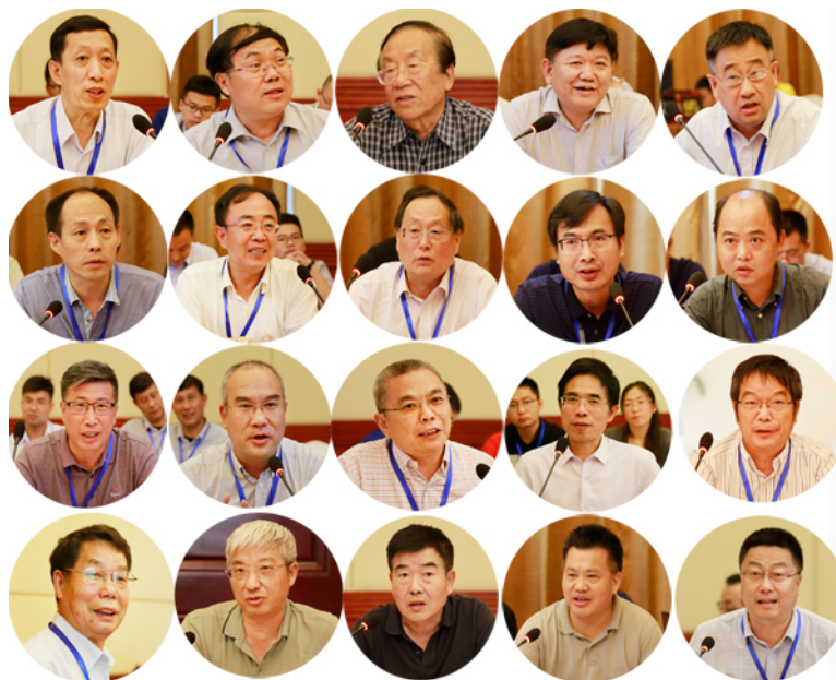
40余位专家教授在研讨会上结合各自研究经历和思考各抒己见

8月18至20日，由我校主办的“第一届土壤侵蚀与水土保持前沿科学问题研讨会”在西安召开。来自国家自然科学基金委、中国科学院前沿与教育局、中国科学院地理科学与资源研究所、中国科学院亚热带农业生态研究所、水利部国际泥沙研究培训中心、中国水利水电科学研究院、黄河水利委员会、黄河上中游管理局、广东省科学院、江西水土保持研究院、北京林业大学、清华大学、浙江大学、北京师范大学、陕西师范大学、西安理工大学、华中农业大学和我校等24个相关单位的60余位代表参加了会议。