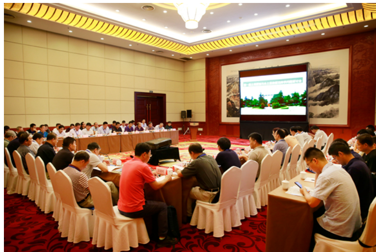
第一届土壤侵蚀与水土保持前沿科学问题研讨会会场

与会代表对本次会议的召开和会议成果给予了高度的肯定与评价，认为本次会议在国家发展的新时代和土壤侵蚀与水土保持学科发展的关键时刻召开，具有非常重要的意义，会议形式新颖，交流内容丰富，观点表达思辨性强，学术认识有冲突有融合，对明确新形势下学科发展的方向和任务、未来研究重点及前沿科学优先主题等问题，以及做好“十四五”科研规划和中长期学科布局具有重要意义。