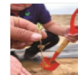
"小柠条"成为农牧民致富的