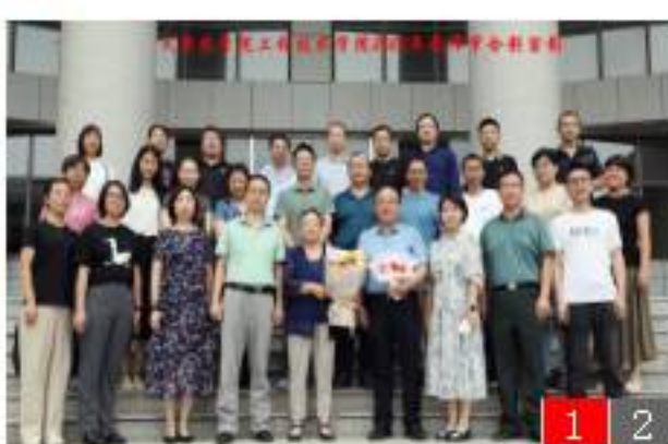
“躬耕教坛，强国有我”我...