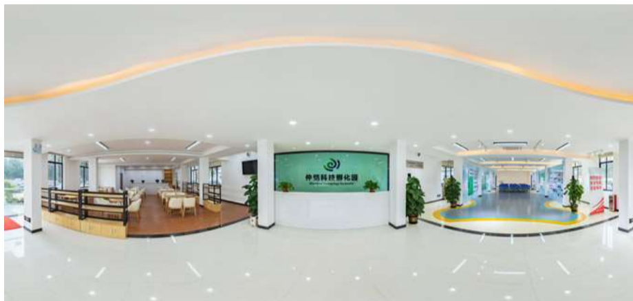
孵化园一楼全景图片

目前,开发公司代表仲恺农业工程学院分别与德庆县、梅州市、广州花都区等地方政府共同建立了仲恺德庆研究院、广梅研究院、广州市花都区仲花现代农业研究院,充分发挥科研院校人才优势对实施乡村振兴战略的支撑引领作用,推动当地相关农业产业升级,促进农业发展和科技进步。