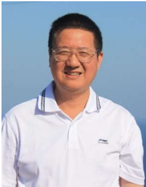
(http://news.ucas.ac.cn/images/article/2017/201704/145426_556476.1.jpg) 孙小淳 教授

这是时隔十四年之后,中国学者再度当选为该院院士。此前入选过四位中国籍院士,依次为:原中国科学院副院长竺可桢(1961年)、中医学史学科创始人王吉民(1966年)、中国科学院院士席泽宗(1993年)、原国际科学史学会主席刘钝(2002年)。本次增选了两位中国籍院士,象征着国际科学史界对中国学者的高度认可,意味着中国学者在国际科学史界的地位提升。