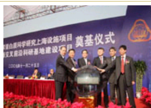
一期工程重点项目中国科学院国家蛋白质科学研究上海...