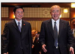
[时政]吴伯雄会刘奇葆