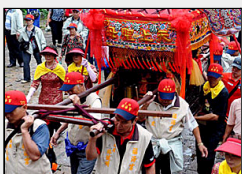
[国内]妈祖神像冒雨回娘家