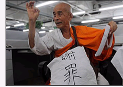
[国内]日本僧人卢沟桥谢罪