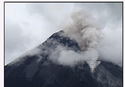
[国际]哥斯达黎加火山喷发