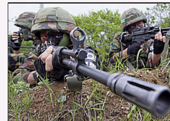
[军事]韩国在韩朝边界军演