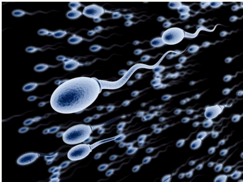
新研究成果有望找到促进精子生成的方法

据每日科学网站报道,《美国实验生物学会联合会杂志》(FASEB Journal)12月刊上刊登了一篇研究报告称,科学家已经发现睾丸中的雄性激素控制精子生成和男性生育的机理,男性可能采用和女性类似的方式避孕。这个发现同时也给那些精子数量少和无生育能力的男性带来了希望。虽然上述结果只在小鼠上进行了验证,在其它哺乳动物例如人类身上也可能得到类似结果。