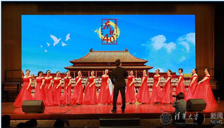
【组图】清华师生歌舞纪念改革开放四十周年