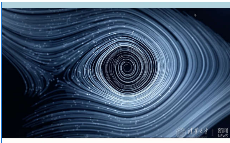
【组图】丝路艺蕴: 中欧女性艺术交流展 览在北京恭王府...