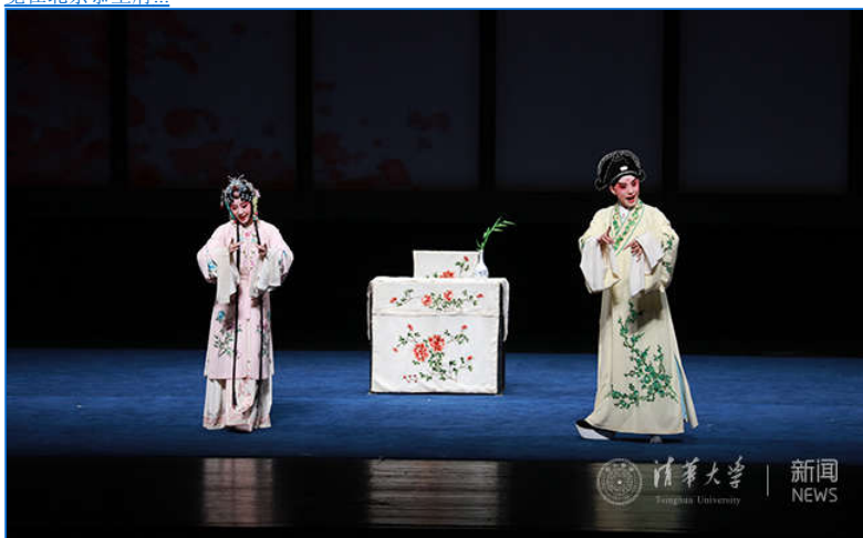
【组图】南昆版《牡丹亭》再次走进清华