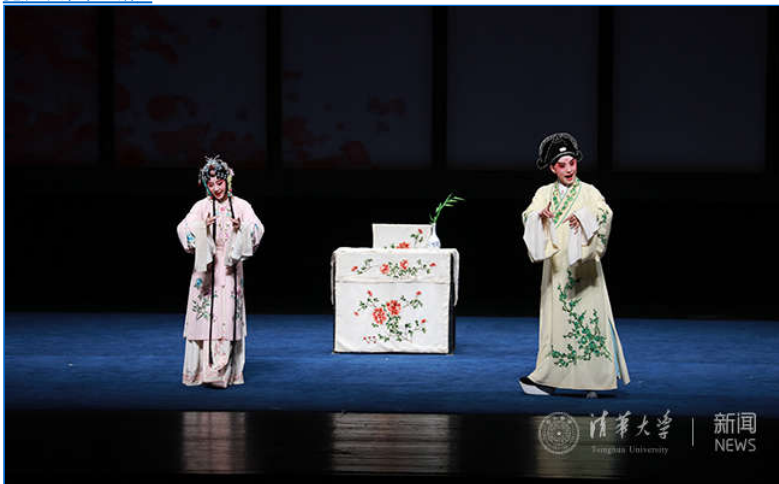
【组图】南昆版《牡丹亭》再次走进清华