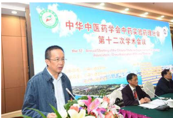
湖南省中医药管理局副局长 李国忠 致辞