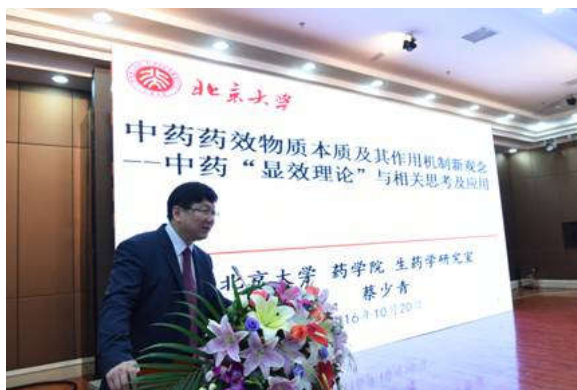
北京大学 蔡少青 教授做大会报告