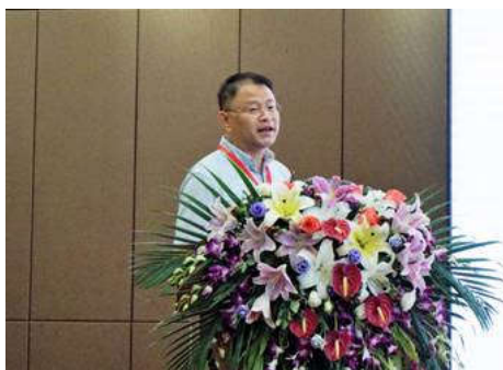
香港浸会大学骨与关节疾病转化医学研究所 张戈 教授做大会报告