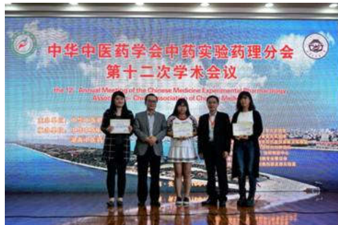
为壁报一等奖获得者颁奖