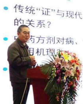
清华大学 李梢 教授做大会报告