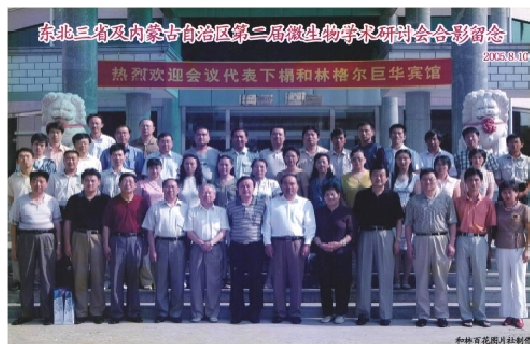
东北三省及内蒙古自治区第二届微生物学术研讨会 2005, 8. 内蒙古 和林格尔

内蒙古学会全体理事及会员一定同心同德, 奋力拼搏, 开拓创新, 为实施西部大开发战略做实事, 为内蒙古的经济腾飞再创佳绩。