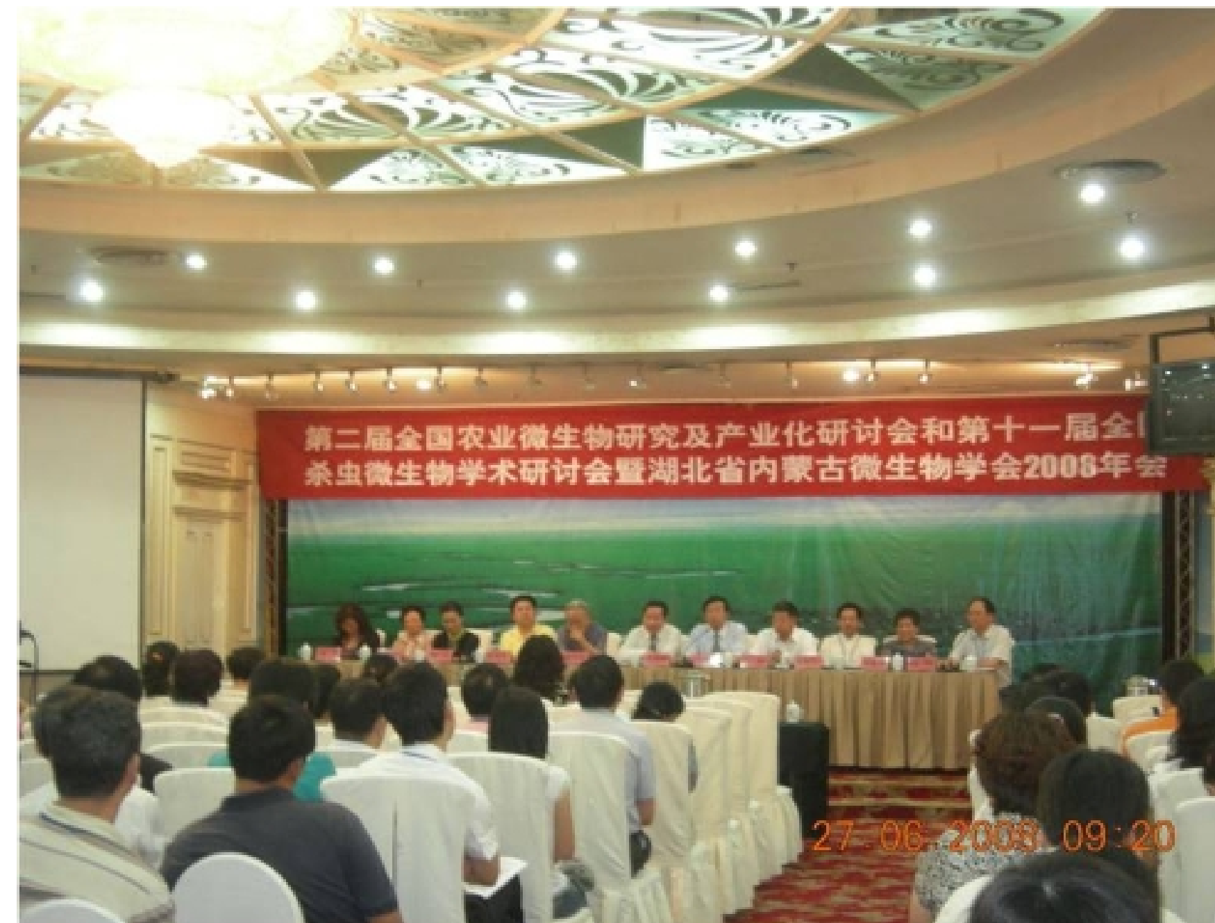
第二届全国农业微生物研究及产业化研讨会暨第十一届全国杀虫微生物学术研讨会 2008, 6. 内蒙古 呼和浩特