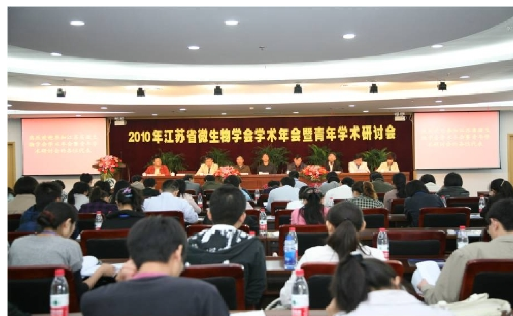
2010年江苏省微生物学会学术年会暨青年学术研讨会 2010, 10. 无锡

学会现设十个专业委员会: 医学微生物专业委员会、兽医微生物专业委员会、工业微生物专业委员会、农业微生物专业委员会、食品微生物专业委员会、环境微生物专业委员会、微生物检验与检疫专业委员会、病毒专业委员会、自然疫原微生物专业委员会、基础微生物专业委员会。另设有学术委员会、组织工作委员会、科普宣传工作委员会和教学工作委员会。学会历年来多次举办大型学术讨论会、中外学者学术报告会、各种形式学习班及培训班, 组织青少年夏令营, 积极参与省科协主办的科普宣传活动。学会每年举办一次学术年会暨青年学术报告会, 编印论文集, 评选优秀论文以资鼓励。自1986年9月创办内部刊物《江苏微生物快讯》(双月刊)。1993年改油印为铅印, 至今共出版98期。