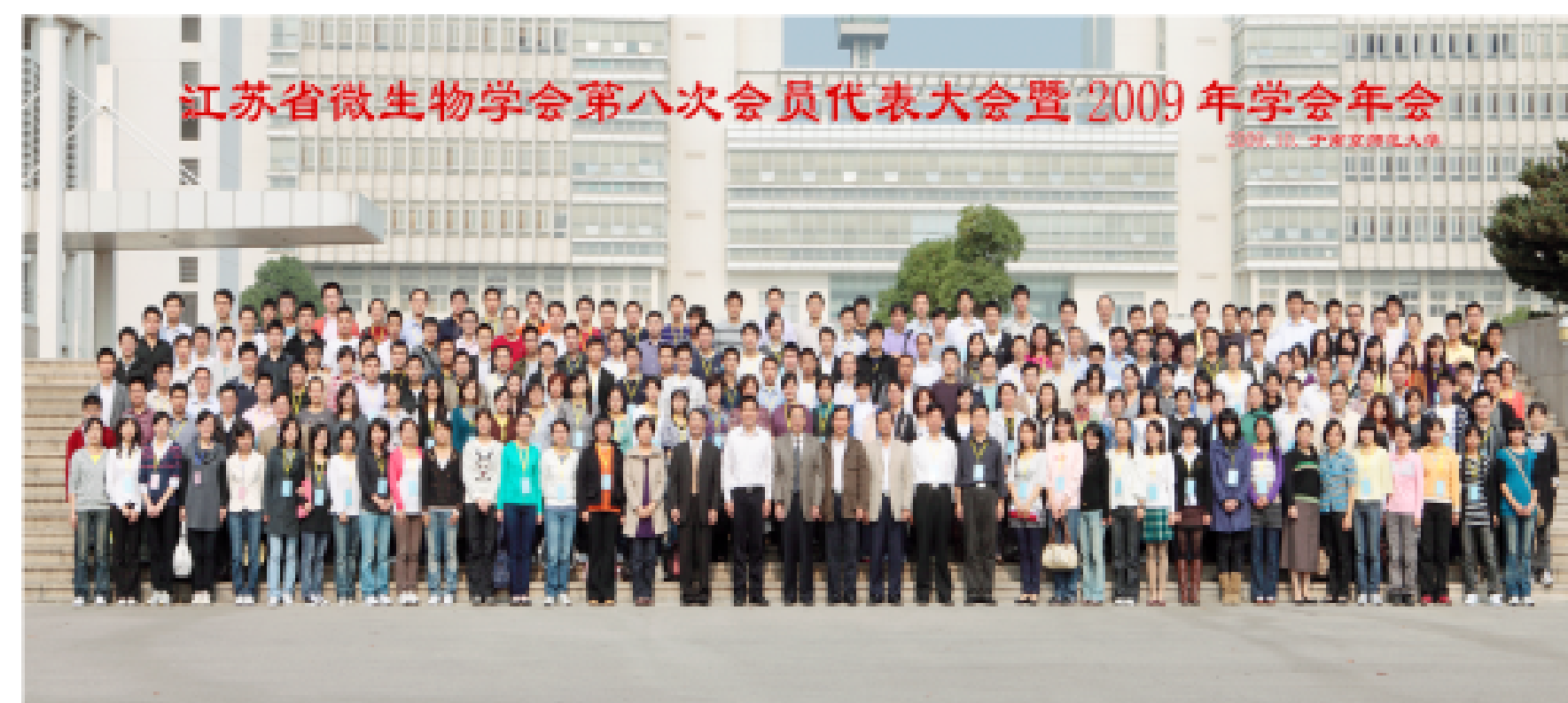
江苏省微生物学会第八次会员代表大会暨2009年学会年会 2009, 10 南京