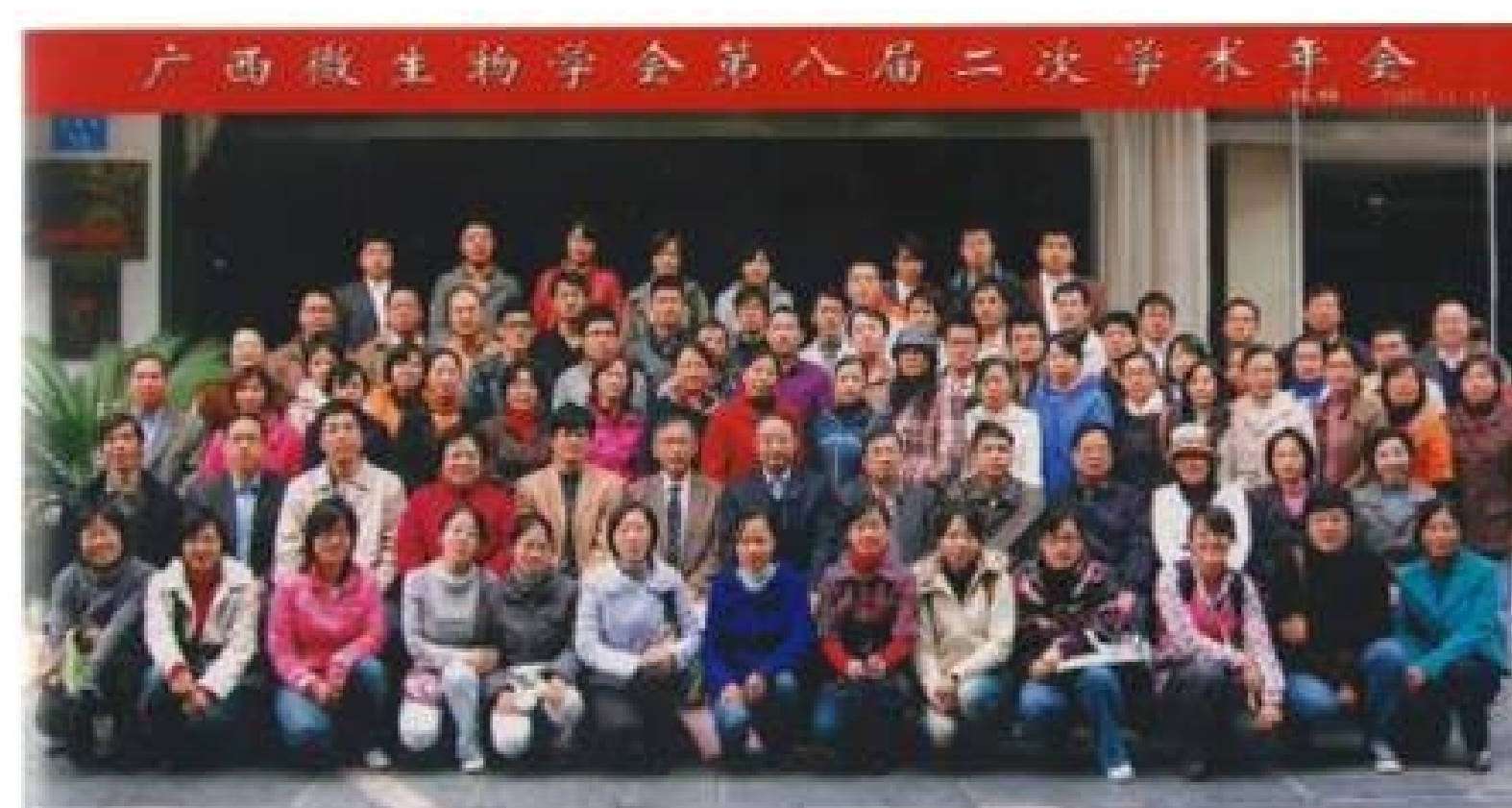
广西壮族自治区微生物学会第八届二次学术年会 2009, 11.桂林

微生物学是一个与免疫学、病毒学、遗传学、生物化学等各学科互相渗透、关系密切的学科,展望未来,广西壮族自治区微生物学会做为一个学术团体,既要遵循以开展学术活动为主要工作的办会宗旨,又应该在发挥人才智力优势、为经济社会服务方面多做贡献。