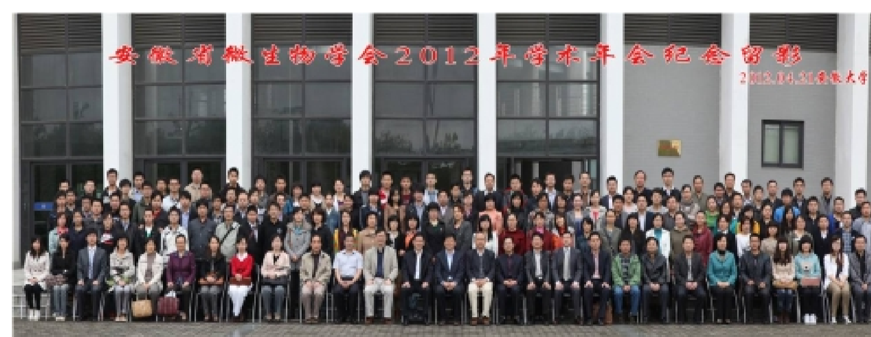
安徽省微生物学会2012年学术年会 2012, 4. 合肥

21世纪是生命科学和生物技术迅猛发展的世纪,安徽省微生物学会将进一步团结全省微生物学工作者,努力提高科技创新能力,促进科技成果转化,为加快安徽经济发展、富民强省作出更大贡献。