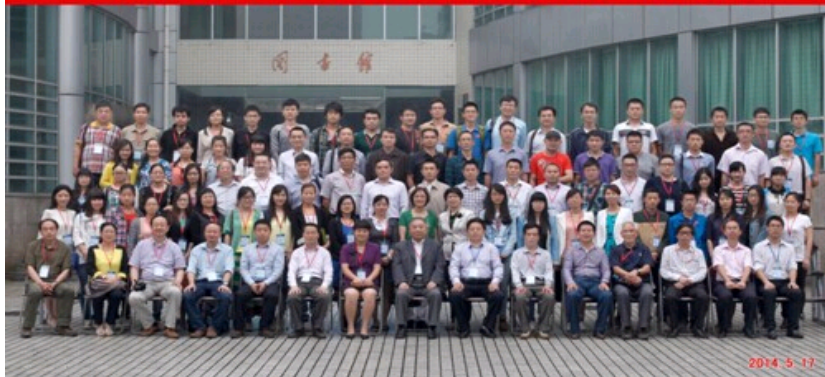
参会代表集体合影