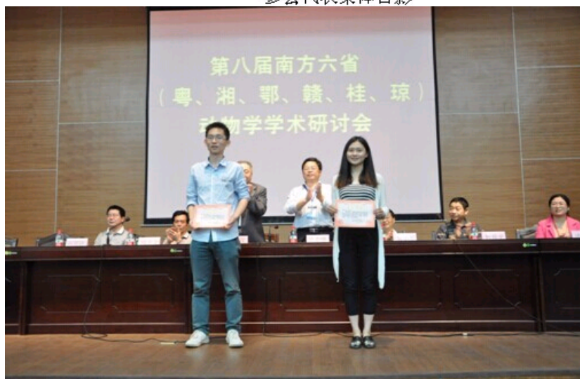
研究生优秀论文报告奖颁奖