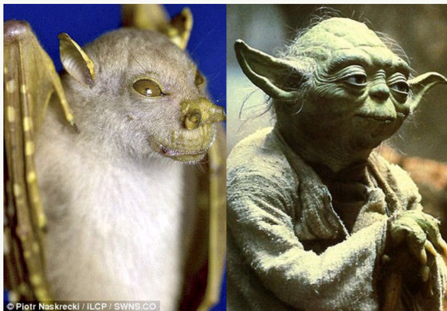
相貌酷似星球大战中的尤达大师的管鼻蝙蝠

据每日邮报报道，最近科学家发现几百个新物种，其中包括相貌酷似星球大战中的尤达大师的管鼻蝙蝠。在一个偏远的雨林，人们发现了一种管鼻果蝠，其相貌很容易让人想起电影《星球大战》中的绝地大师尤达。2009年，在崎岖多石、人迹罕至的那卡耐和马勒山脉，人们经过历时两个月的调查，首次发现了两百多种动植物。