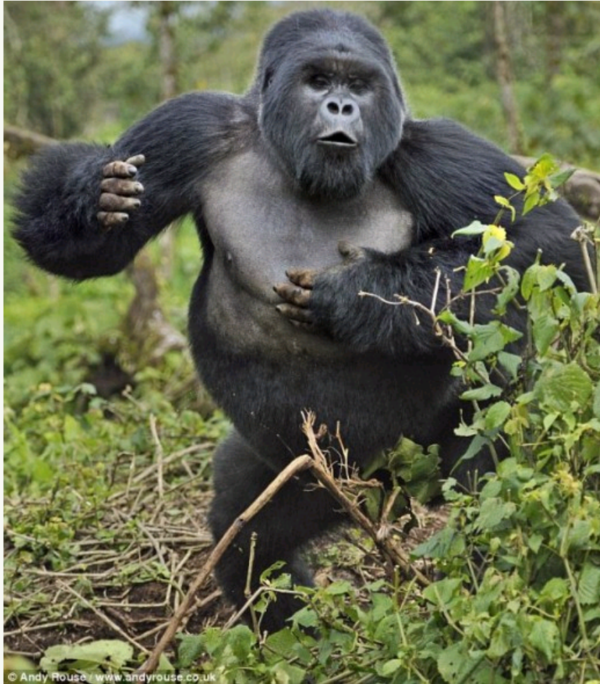
大猩猩通过用力捶打胸部的的方式，来展示自己的力量和突出地位