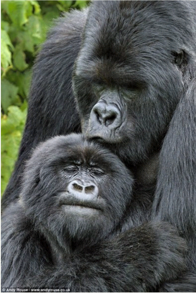
基戈马与一只雌性交配后，深情地在它前额吻了一下

北京时间6月5日消息，据国外媒体报道，看到一只巨大的银背山地大猩猩锤击着胸脯快速靠近自己，大部分人可能都会被吓得掉头就逃。但是对获奖野生生物摄影师摄影师安迪·洛兹来说，大猩猩的这一举动说明它正在努力吸引异性的注意，对人并没有什么恶意。