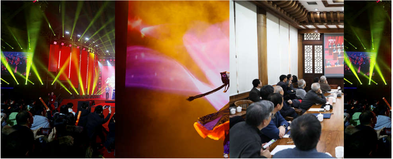
【组图】欢歌共聚清华园 携手追梦又一年