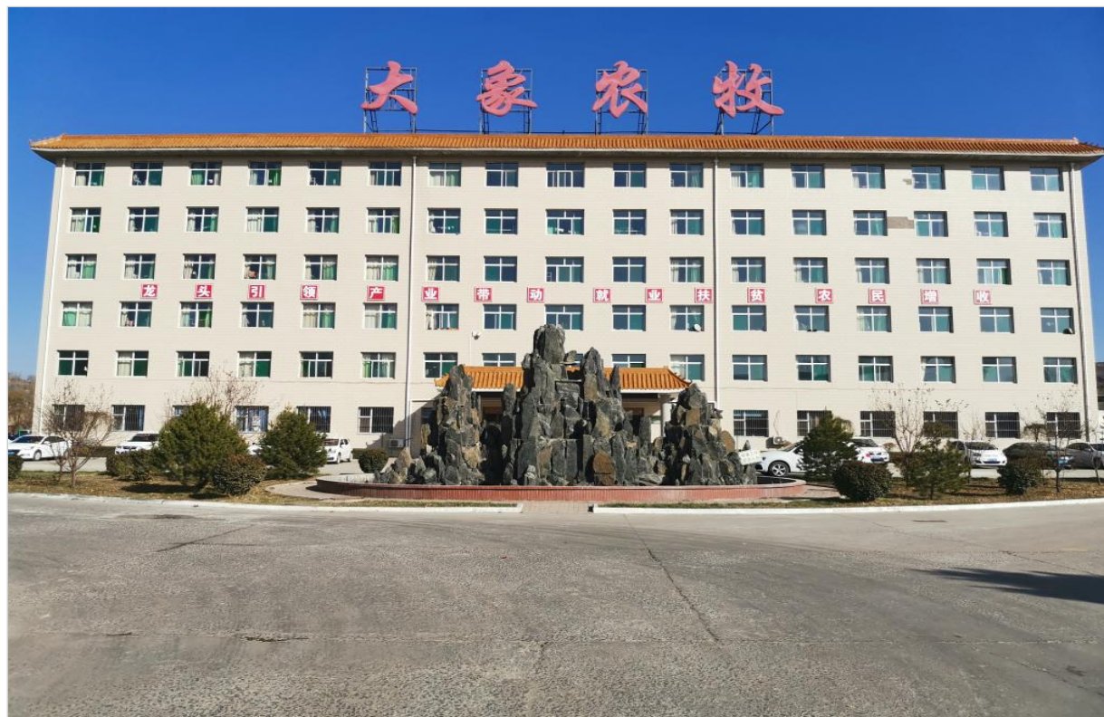
学院校外教学科研实习实践基地-大象农牧集团有限公司