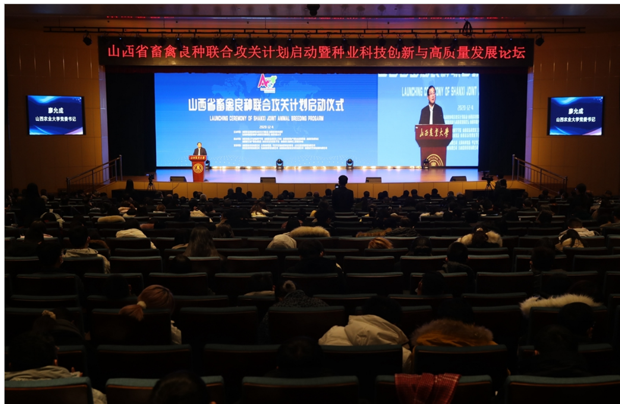
2020年成功举办畜禽种业科技创新与高质量发展论坛