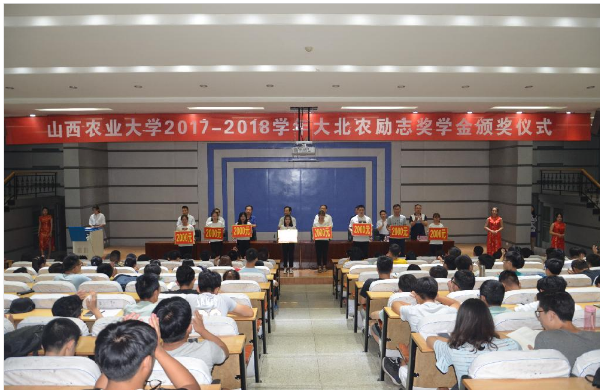
大北农奖学金颁奖仪式

新起点、新征程、新希望，动物科学学院将在新的发展征程中，不忘初心，乘风破浪，为打造动物科学学院新的辉煌而不懈奋斗！