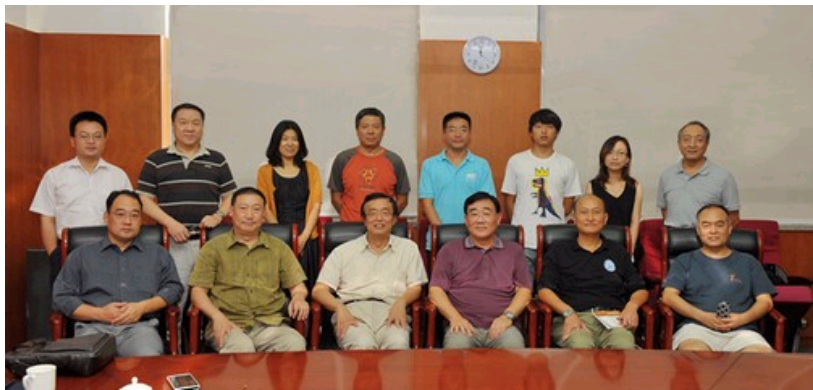
座谈会各位专家老师