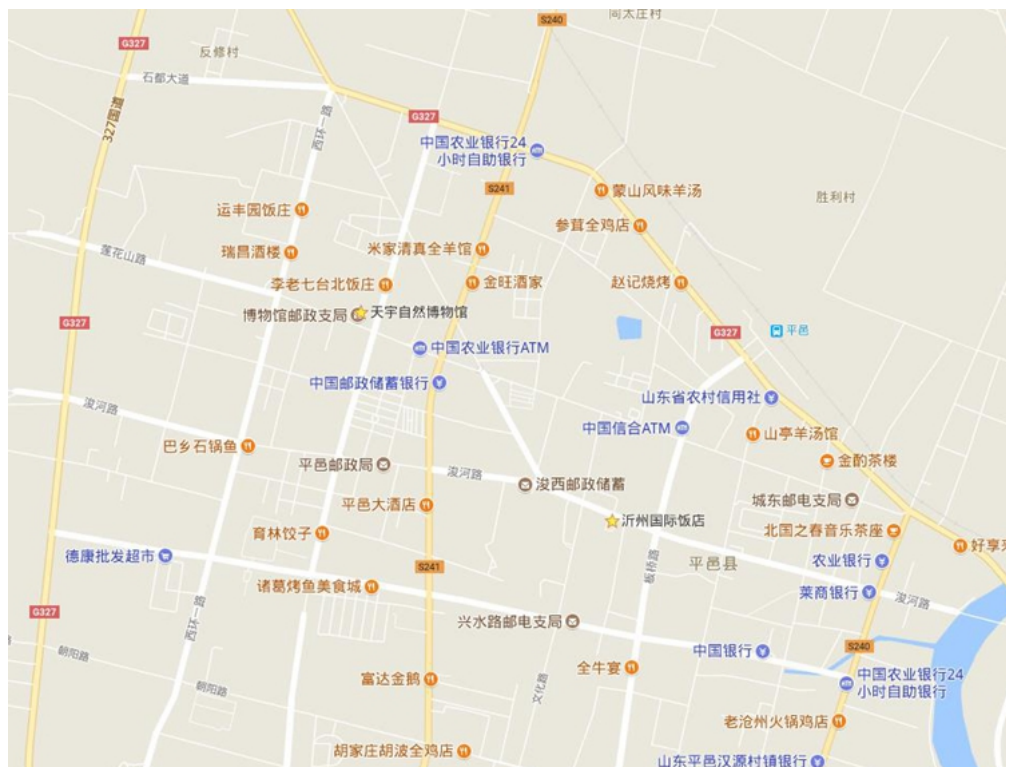
天宇自然博物馆与沂州国际饭店的位置