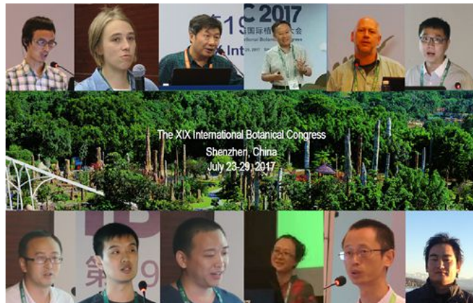
版纳植物园科技人员作分会报告

国际植物学大会(International Botanical Congress,简称IBC)创办于1900年,是由国际植物学会和菌物学会联合会(International Association of Botanical and Mycological Societies,简称“IABMS”)授权举办的植物科学大会,涵盖了植物科学领域所有分支学科,是全球植物科学领域规模最大、水平最高的学术会议。国际植物学大会每6年举办一次,全面展示植物科学领域最新的研究成果,是植物科学研究领域多学科交流与合作的重要平台。第20届国际植物学大会将于2023年在巴西里约热内卢举行。