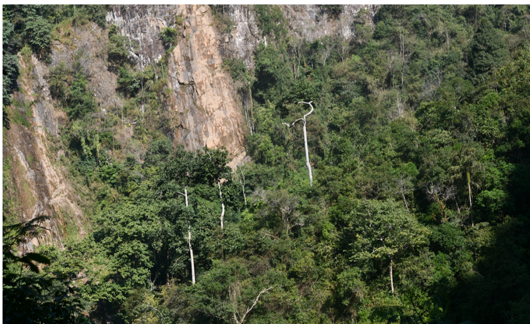
野外分布的东京龙脑香