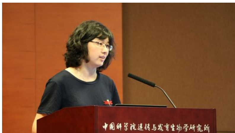
( http://newsucas.ac.cn/images/article/2018/201808/141338_219384.luntan4.jpg )