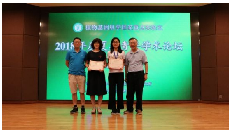
( http://news.ucas.ac.cn/images/article/2018/201808/141416_924773.luntan8.jpg )