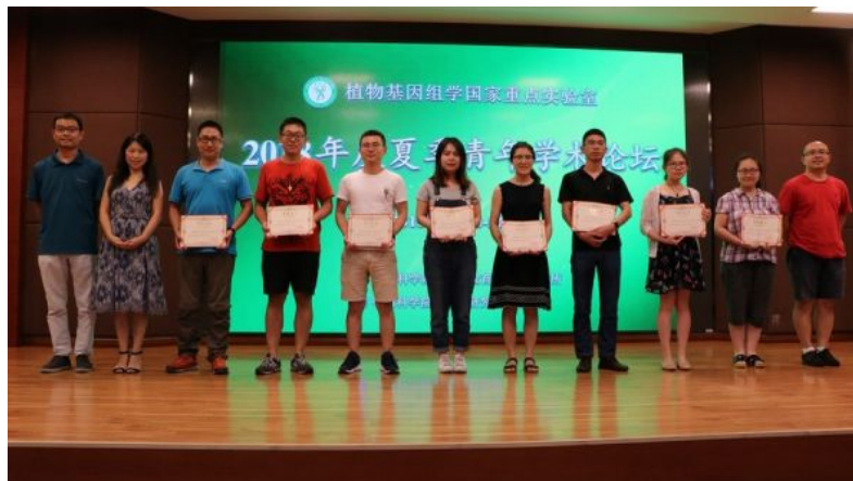
( http://news.ucas.ac.cn/images/article/2018/201808/141427_749798.luntan9.jpg )