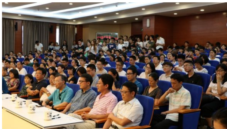
( http://news.ucas.ac.cn/images/article/2018/201808/141351_978022.luntan5.jpg )