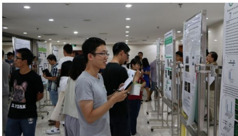
( http://news.ucas.ac.cn/images/article/2018/201808/141405_245126.luntan6.jpg )