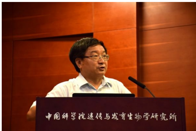
( http://newsucas.ac.cn/images/article/2018/201808/141310_198851.luntan2.jpg )