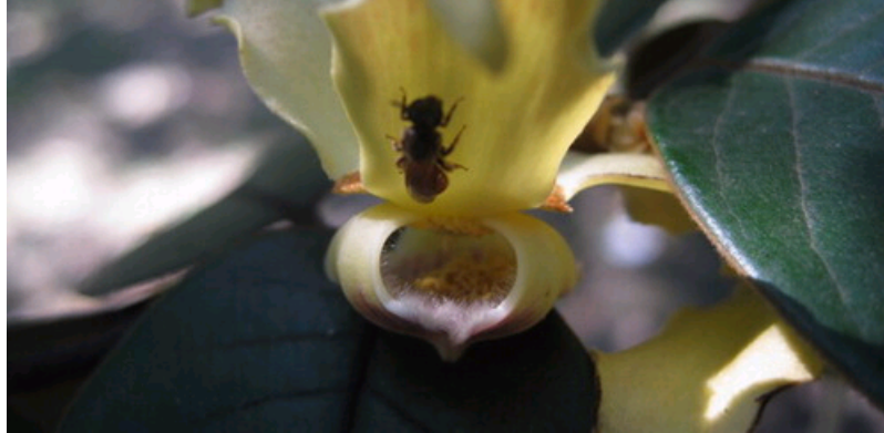
银钩花及其访花昆虫